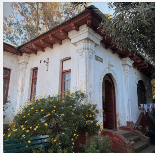
GOTA DE LECHE

Este importante avance se concretó mediante la firma de un oficio dirigido al Secretario Técnico del Consejo de Monumentos Nacionales, marcando un nuevo hito en la recuperación de espacios históricos que forman parte de la identidad, memoria y orgullo de las familias lotinas.