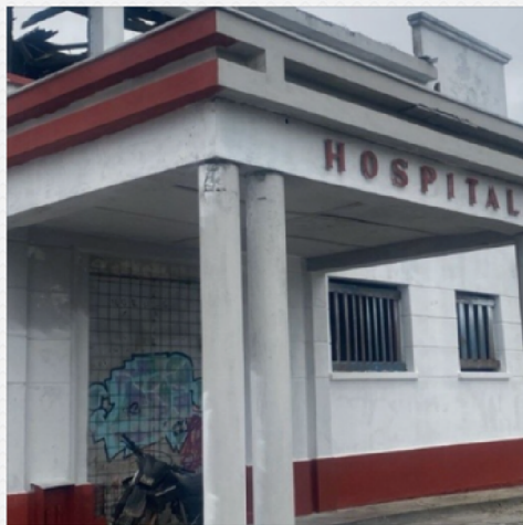
EX HOSPITAL ENACAR